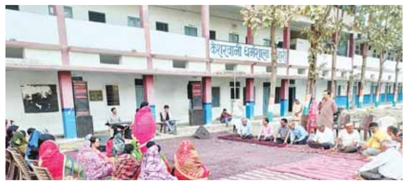
से पुरुष, महिला उपस्थित होकर रंगोत्सव पावन पर्व पर होली मिलन हुआ एक दूसरे ऊपर *गुलाल अबीर डाल से खेली गई रंगोत्सव (होली) फिर एक दूसरे के गले मिल मनाया गया रंगोत्सव होली मिलन समारोह संपन्न हुआ

धर्मशाला के मैदान में उपस्थित होकर रंगोत्सव पावन पर्व व होली मिलन समारोह आयोजित किया गया ब्योहारी केसरवानी वैश्य समाज के तत्वावधान में हर साल कि तरह इस साल भी केसरवानी धर्मशाला के मैदान में *भगवान कश्यप गोत्रार्चय जी के छाया चित्र पर फूल माला पहनाकर कर आज के कार्यक्रम अध्यक्ष व उपास्थि वरिष्ठ व समाज केसरवानी समाज के महिला पुरुष लोग दीप प्रज्वलित कर के बाद रंगोत्सव व होली मिलन में समाज के वरिष्ठ लोगों व केसरवानी वैश्य समाज से तीन सभा के अध्यक्ष सहित पदाधिकारी, महिला सभा अध्यक्ष सहित सभी पदाधिकारी व तरुण सभा के पदाधिकारी सहित समाज