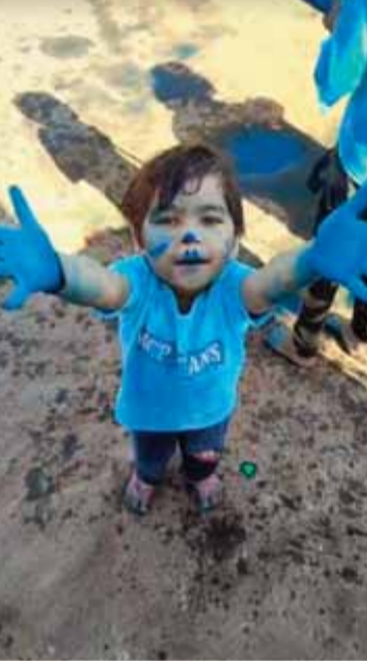
हरिभूमि न्यूज कोतमा।

उमंग, उल्लास का प्रतीक रंगों का त्योहार रंगोत्सव हर्षोल्लास से मनाया गया। कोतमा, भालुमाड़ा, जमुना सहित कोयलांचल एवं ग्रामीण क्षेत्र रंगों से सराबोर रहा। चारों ओर अबीर-गुलाल उड़ा। डीजे की धुन और ढोल की थाप पर बच्चे व युवा झूमते रहे और एक-दूसरे पर रंग उड़ेलते रहे। लोगों ने गुलाल लगाकर एक-दूसरे को होली की शुभकामनाएं दी।