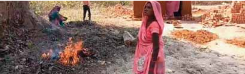
ने थाना कोतमा प्रमारी एवं राजस्व विभाग के अधिकारियों से तत्काल कार्रवाई कर शासकीय भूमि को

आजाद चौक पर एकत्र हुए। और जमकर महिलाएं बच्चे होली का आनंद उठाते नजर आए। कोतमा नगर में होली का पर्व उल्लास से मनाया गया। लोगों ने एक दूसरे को गुलाल व रंग लगाकर होली की शुभकामनाएं दी। लोग सुबह से ही टोली बनाकर एक दूसरे को बधाईयां देते रहे। ग्रामीण क्षेत्रों में होली का पर्व धूमधाम और शांतिपूर्ण तरीके से मनाया गया। गांवों में युवा सड़क से गुजर रहे लोगों पर रंग लगाते नजर आए। कोतमा नगर में होली पर सुबह से बच्चों ने पिचकारी में रंग भरकर एक-दूसरे को भिगोया। बच्चों के अलावा बड़ों ने भी एक-दूसरे को गुलाल लगाकर शुभकामनाएं दी। युवकों ने डीजे पर जमकर डांस किया। जगह-जगह होली मिलन कार्यक्रम आयोजित किए गए। सुरक्षा के मद्देनजर पुलिस भी अलर्ट रही। क्षेत्र में होली पर्व शांतिपूर्वक मनाया